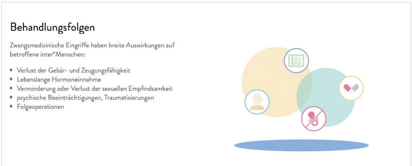
Abb. 4: Screenshot Inter* Fortbildung