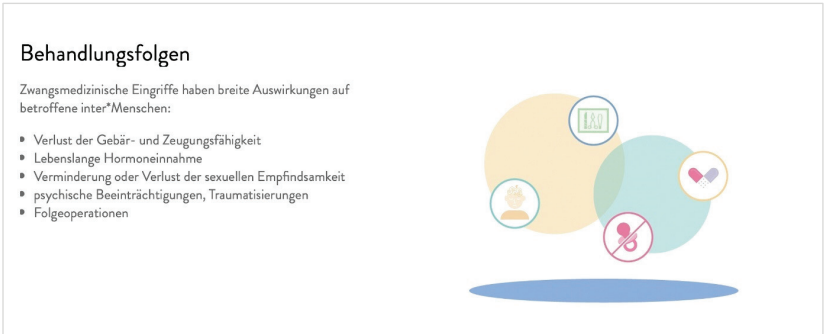
Abb. 4: Screenshot Inter* Fortbildung