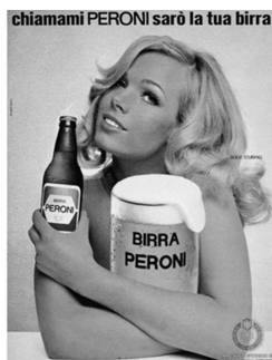
Abb. 5: Birra Peroni , Italien, 1965