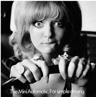
Abb. 4: Mini , Großbritannien, 1968

jedoch weitestgehend dieselben geblieben. 267 Nach wie vor steht die Hausfrau und Mutter im Fokus. Darüber hinaus wird verstärkt auf die junge und attraktive Frau als Werbebild gesetzt. Sie wird vollbusig und spärlich bekleidet oder als naiv und intellektuell beschränkt abgebildet. 268 In einer britischen Werbung der Marke Mini für ein Auto mit Automatikgetriebe ist eine nervöse Frau am Steuer zu sehen. In der Bildunterschrift heißt es: „For simple driving“ (Abb. 4). In Italien illustriert beispielsweise eine Bierwerbung der Marke Birra Peroni , wie Frauen häufig als „sexy Dekorationsobjekte“ eingesetzt werden (Abb. 5).