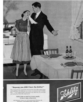
Abb. 3: Schlitz Brewing, Großbritannien, 1950

Werden Mann und Frau in einer Werbung abgebildet, nimmt in der Regel der Mann „die Machtposition der Werbedramaturgie“ ein und die Frau „belehrt oder berichtigt, wenn sie nicht gerade als schmückendes Beiwerk oder als Fachfrau im Haushalt eingesetzt wird“. 256 Steht die Frau im Mittelpunkt der Werbekampagne, geht es zumeist um die Optimierung des Haushalts oder des Familienlebens. 257 In einem Dr. Oetker -Werbefilm von 1954 heißt es beispielsweise: „Eine Frau hat zwei Lebensfragen: Was soll ich anziehen und was soll ich kochen?“ 258 Männer sind demgegenüber in Werbung für Genussmittel wie alkoholische Getränke oder Zigaretten zu sehen. Sie werden als gesellig, karrierebewusst, Experten oder als Ober-