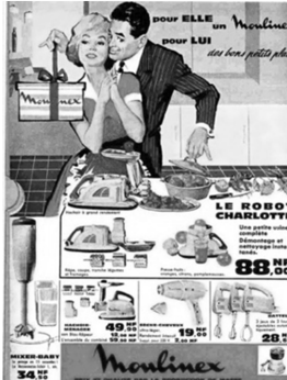
Abb. 2: Moulinex, Frankreich, 1950