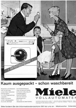
Abb. 1: Miele, Deutschland, 1961

Ziel der Frau an, den Haushalt zu führen und ihrem Ehemann ein wohl-schmeckendes Essen zu servieren. 254 Der Mann wird demgegenüber als selbstbewusster Geschäftsmann, Familienversorger oder abenteuerlustiger Draufgänger porträtiert. 255