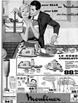
Abb. 2: Moulinex, Frankreich, 1950