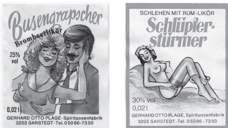
Abb. 12: „Busengrabscher“ und „Schlüpfierstürmer“, Deutschland, 1990

Die Vorinstanzen (Landgericht Berlin und das Kammergericht) 774 hatten die Flaschenetiketten als einen „Scherz mit sexuellen Phantasievorstellungen“, der zwar „geschmacklos“, aber für Werbekampagnen üblich sei, bewertet. 775 Ergänzend meint das Kammergericht, dass „[f]ür die moderne Werbung [...] kennzeichnend ist, daß sie durch drastische Schlagworte, frivole Texte und sexbetonte Bilder die Aufmerksamkeit des Publikums zu erwecken sucht“. 776 Aufgrund der Gewöhnung des Publikums an eben solche Werbebilder, könne nach der Bewertung des Gerichts bei den Abbildungen nicht von einer Verletzung des sittlichen Empfindens der adressierten Verkehrskreise gesprochen werden. 777