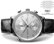
Abb. 15: IWC Schaffhausen, 2002

Scheiben putzen ist Männersache. Bis 42 mm Durchmesser.