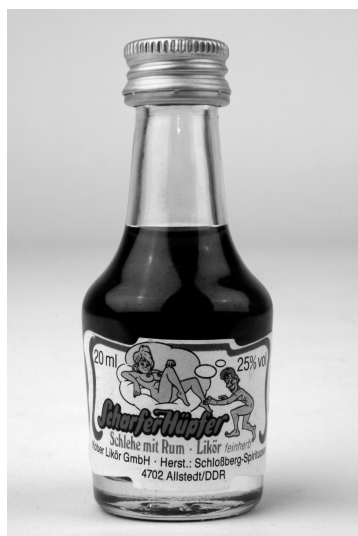
Abb. 14: Harzer Likör, Deutschland, 1990