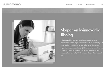
Abb. 34: Supermama, Tegra Nordics, 2019

Demgegenüber kam der RON in einer Werbung für einen Klebstoff zu einem anderen Beurteilungsergebnis. In dieser war in einem ersten Bild eine Frau zu sehen, die ihren Ehemann bittet, Wandhaken im Badezimmer anzubringen. Daneben stand der Text: „Nicht jetzt‘ macht uns verrückt. Dauert es eine Woche oder sogar länger, wenn Sie Ihren Partner bitten, einen Haken im Badezimmer zu befestigen?“ In einem zweiten Bild bringt die Frau die Haken dank des beworbenen Klebstoffs selbst an. Hier lautete die Überschrift: „Endlich eine frauenfreundliche Lösung“ (erstes Bild siehe Abb. 34). Der RON führte dazu aus, dass die Werbung den Eindruck erwecke, dass Frauen handwerkliche Aufgaben nicht allein übernehmen könnten und daher einen speziell angepassten Kleber benötigen würden, um Hausarbeiten durchführen zu können. Ebenso lege die Werbung nahe, dass Männer faul wären und Projekte zu Hause häufig verzögern würden. Zusammenfassend würde die Werbung damit nicht nur Frauen, sondern gleichermaßen Männer in stereotyper und abfälliger Weise darstellen. Dementsprechend sei die Werbung sexistisch und verstöße gegen Art. 2 Abs. 1 des ICC-Kodexes. 1253