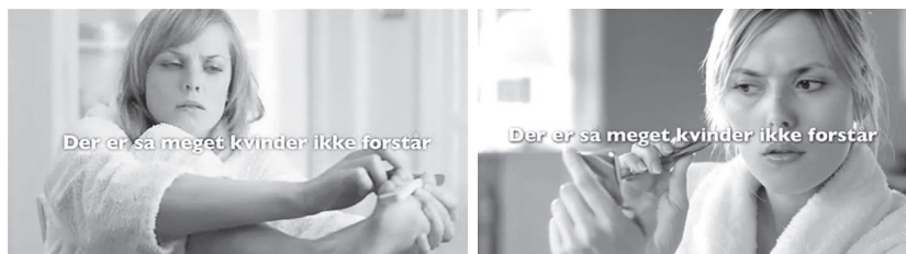
Abb. 29: Oddset, Dänemark, 2017

stereotypen Weise darstellen, überwiegend zulässig. 1118 Dies wird teilweise von der Presse kritisiert. 1119