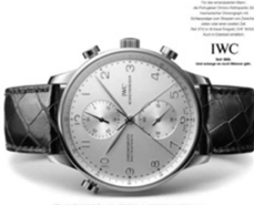
Abb. 15: IWC Schaffhausen, 2002

Scheiben putzen ist Männersache. Bis 42 mm Durchmesser.