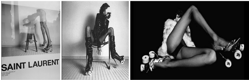
Abb. 25: Yves Saint Laurent Werbung, 2017

unter den Schuhen abbildete (Abb. 25), kam die JDP zu dem Schluss, dass die Werbebilder die Frauen in sexuellen, leicht unterwürfigen Posen zeigen würden, die die Frauen zum Sexualobjekt degradieren und die Unterlegenheit der Frau in der Gesellschaft suggerieren würde. 1039