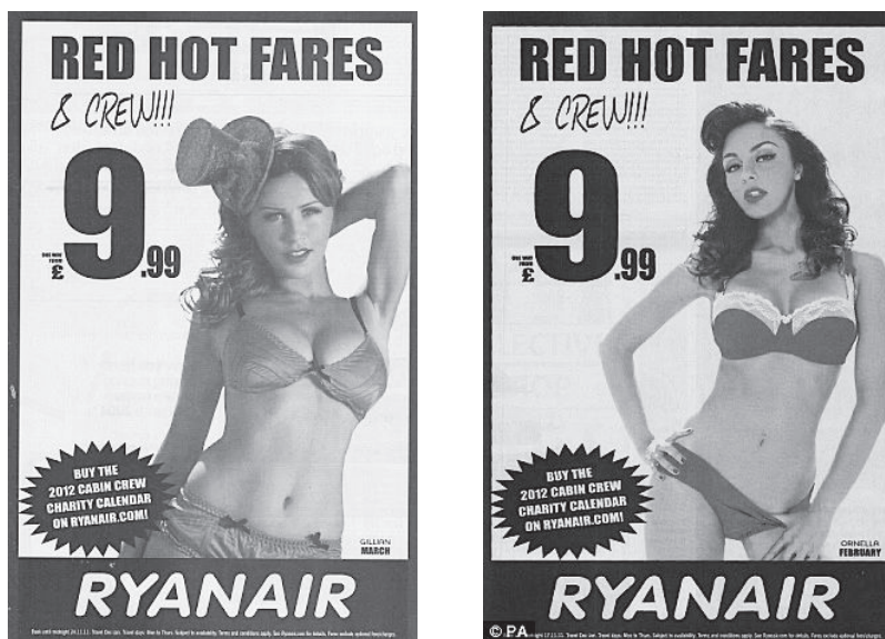
Abb. 30: Ryanair, 2012

Ebenso beschränkten sich die Richter:innen in einer Entscheidung von 2017 auf die Einstellung der Verwendung der Werbeanzeige und das Verbot, diese künftig erneut zu veröffentlichen. Darüber hinaus musste das betroffene Unternehmen die vollständige Entscheidung auch in diesem Fall auf eigene Kosten in der Zeitung abdrucken lassen, in der die Werbung ursprünglich veröffentlicht worden war. 1135