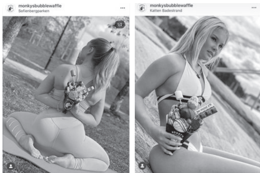
Abb. 28: Bubble Wrap AS/Monkys Bubble Waffle, 2020

2020 gingen 36 Beschwerden ein, von denen 28 auf eine einzige Werbekampagne für Eiswaffeln der Firma Bubble Wrap AS/Monkys Bubble Waffle fielen. 1096 In dieser wurden leicht bekleidete Mitarbeiterinnen des Unternehmens in sexuellen Posen abgebildet (Abb. 28), wobei zum einen die mangelnde Produktrelevanz, zum anderen der Fokus auf den Körper der Frauen kritisiert wurde. Neben der erheblichen Kritik durch die Forbrukertilsynet erhielt der Fall viel Medienaufmerksamkeit. Infolgedessen wurden die Marketing-Posts auf dem Instagram-Konto des Unternehmens entfernt und der General Manager von Monkys Bubble Waffle entschied sich, das Unternehmen zu verlassen. 1097