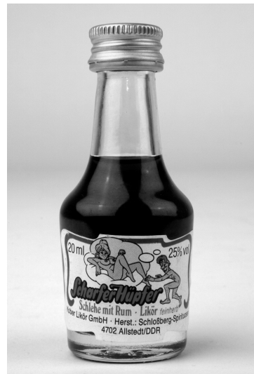
Abb. 14: Harzer Likör, Deutschland, 1990