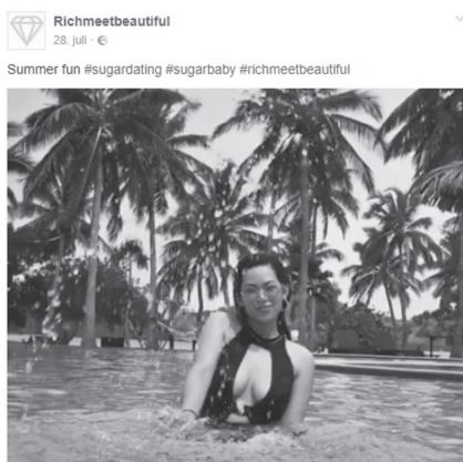
Abb. 26: RichMeetBeautiful, 2017