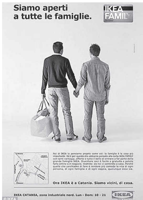
Abb. 32: Ikea, Italien, 2011

scheinen Werbungen, die nicht heteronormativen Leitbilder entsprechen, in Italien von einigen Rezipient:innen sogar als anstößig empfunden zu werden. So sorgte eine Kampagne, die mit einem homosexuellen Paar warb (Abb. 32), in Teilen des Landes für große Aufregung. 1218 Die Zeitung il Giornale , die im Besitz von Paolo Berlusconi , dem Bruder des ehemaligen Ministerpräsidenten Silvio Berlusconi , ist, bezeichnete sie beispielsweise als „Campagna choc“ (Schockkampagne). Sie warf dem werbenden Unternehmen vor, in der katholischen Provinz Catania mit der Werbedarstellung provozieren zu wollen. 1219