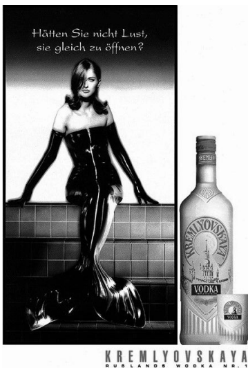
Abb. 13: Kremlyovskaya, Deutschland, 1995

zu sehen, die ein enganliegendes schwarzes Latexkostüm mit einem langen Reisverschluss trug und lasziv in die Kamera blickte. Neben ihr war eine Wodkaflasche abgebildet. Darüber prangte der Slogan: „Hätten Sie nicht Lust, sie gleich zu öffnen?“ (Abb. 13). 793 Die Richter:innen erkannte keinen Verstoß gegen die guten Sitten. Zwar hätte die Abbildung einen unübersehbaren erotischen Bezug. Ein eindeutiger sexueller Gehalt durch eine übertriebene Herausstellung sexueller Elemente fehle jedoch. 794 Insbesondere der Slogan sei in dieser Hinsicht mehrdeutig, so dass die Anzeige nur mit möglichen Assoziationen spiele. Hinzu komme, dass die Frauengestalt durch die Flosse entfremdet sei. Damit gehe die Werbung nicht über den Einsatz sexueller Anspielungen hinaus, so dass nicht von einer unzulässigen Wettbewerbshandlung in Form einer Geschlechterdiskriminierung ausgegangen werden könne. 795