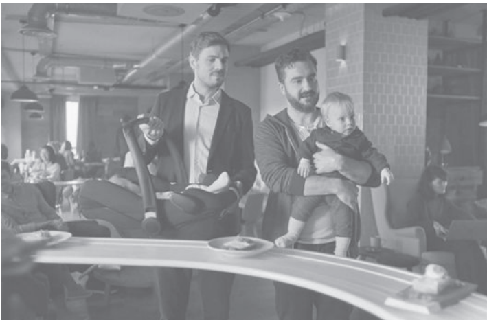
Abb. 31: Philadelphia, 2019

Nach einer Erklärung der ASA könne grundsätzlich nicht davon ausgegangen werden, dass die Verwendung von Humor oder Anspielungen die schädlichen oder beleidigenden Auswirkungen einer Anzeige abschwächen. So würden problematische Darstellungen nicht unproblematisch, nur weil sie als Scherz gemeint seien. 1186