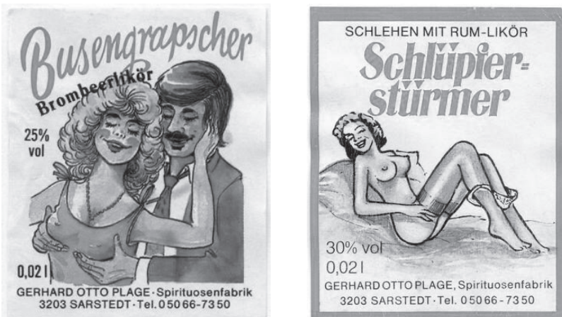
Abb. 12: „Busengrabscher“ und „Schlüpfierstürmer“, Deutschland, 1990

Die Vorinstanzen (Landgericht Berlin und das Kammergericht) 774 hatten die Flaschenetiketten als einen „Scherz mit sexuellen Phantasievorstellungen“, der zwar „geschmacklos“, aber für Werbekampagnen üblich sei, bewertet. 775 Ergänzend meint das Kammergericht, dass „[f]ür die moderne Werbung [...] kennzeichnend ist, daß sie durch drastische Schlagworte, frivole Texte und sexbetonte Bilder die Aufmerksamkeit des Publikums zu erwecken sucht“. 776 Aufgrund der Gewöhnung des Publikums an eben solche Werbebilder, könne nach der Bewertung des Gerichts bei den Abbildungen nicht von einer Verletzung des sittlichen Empfindens der adressierten Verkehrskreise gesprochen werden. 777