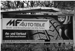
Abb. 21: MF-Autoteile, 2019

Ein Blick auf die Anwendungspraxis belegt eine starke Tendenz zur Kooperation durch große Unternehmen und Werbetreibende mit hoher Reichweite. Vorrangig wird das Sanktionsmittel gegenüber kleineren und regionalen Einzelunternehmen verhängt. 950 2019 wurden beispielsweise insgesamt neun öffentliche Rügen aus dem Grund der Geschlechterdiskriminierung ausgesprochen, von denen fast alle Adressierten kleinere Unternehmen waren und die gerügten Werbungen sich ausschließlich auf einzelnen Werbetafeln befanden ( Abb. 21 u. 22 ). Ebenso suggeriert die Rügebilanz aus 2020, dass größere Firmen und Werbeagenturen in der Regel gewissenhafter mit einem Hinweis des Werberats umgehen als kleinere Unternehmen oder Einzelpersonen, die sich häufig unbeeindruckt zeigen. 951