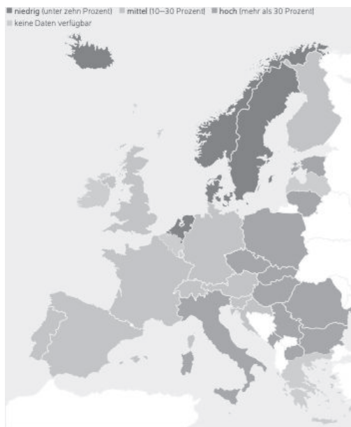
Abb. 10: Anteil der Bevölkerung mit traditionellen Rollenvorstellungen der Geschlechter in Europa

Eine ähnliche Tendenz zeigt sich auch in einer anderen Studie, die die Zustimmung zur Aussage „es ist die Aufgabe des Mannes, Geld zu verdienen, die Frau ist für Haushalt und Familie zuständig“ untersucht hat. Während die nordischen Staaten mit Ausnahme von Finnland sowie die Niederlande die egalitärsten Einstellungen zur Rollenverteilung von Frauen und Männern vertraten, 665 wies Italien zusammen mit vielen osteuropäischen Staaten eine Zustimmungsrate von rund 34 Prozent auf (Abb. 10). 666