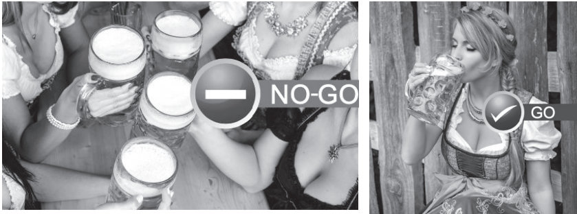
Abb. 24: Beispielbilder zum Bildausschnitt, Leitfaden Österreichischer Werberat, 2018

und dem Produkt geachtet wird, insbesondere wenn eine blickfangartige Darstellung vorliegt (Abb. 24).