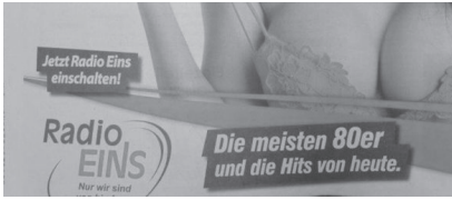
Abb. 19: Radio EINS, Deutschland, 2015

torms durchaus auf die Regulierung von Werbeinhalten einwirken sowie die Grenzen des Zulässigen mitprägen.