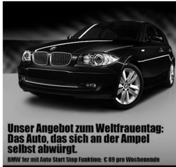
Abb. 16: Sixt, 2011