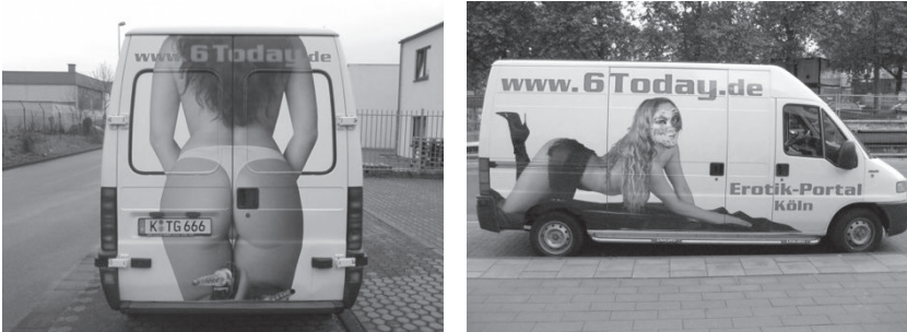
Abb. 11: Kleinlastwagen, Beschluss OVG Nordrhein-Westfalen, 2009

ellen Inhalts umfasst, relevant. 744 Ob eine Werbeanzeige den Tatbestand erfüllt, hängt maßgeblich von zwei Aspekten ab. Zum einen muss es sich um eine Darstellung sexuellen Inhalts handeln. Zum anderen muss die Darstellung in einer derart anstößigen Weise erfolgen, dass von einer unzumutbaren Belästigung der Rezipient:innen ausgegangen werden kann. 745 Eine Darstellung sexuellen Inhalts liegt in der Regel vor, wenn ein menschlicher Körper abgebildet ist und das objektive Erscheinungsbild auf das Geschlechtliche bezogen ist 746 oder sich die Gelegenheit zu sexuellen Handlungen objektiv aus den Umständen ergibt. 747 Darstellungen der Nacktheit sind nur dann sexuellen Inhalts, wenn ein Sexualbezug besonders hervorgehoben wird. 748 Wann eine unzumutbare Belästigung vorliegt, richtet sich nach dem Zusammenhang zwischen der Darstellung und dem Ausstellungsort sowie nach den wertungsgeprägten Grenzen der Zumutbarkeit. 749