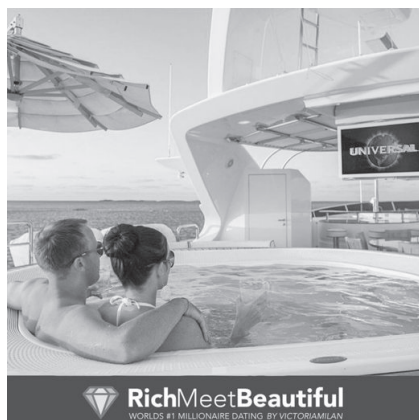
Abb. 27: RichMeetBeautiful, 2019

2018 gingen neun Beschwerden und 2019 zwölf Beschwerden zu geschlechterdiskriminierender Werbung ein, von denen keine von der Forbrukertilsynet als problematisch bewertet wurde. Allein eine Werbeanzeige bei der die Forbrukertilsynet eigeninitiativ tätig geworden war, wurde als Verstoß gegen § 2 Abs. 2 MFL gewertet. 1095