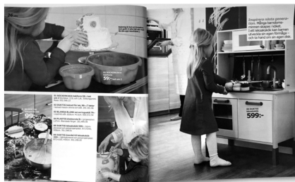
Abb. 33: Ikea-Katalog, 2015

sexistisch. Die gemeldete Seite müsse im Lichte des gesamten Katalogs ausgelegt werden, der insgesamt kein abfälliges Frauenbild vermittele. 1252