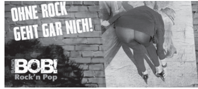
Abb. 20: Radio Bob, Deutschland, 2015

Teilweise wird kritisiert, dass die Entscheidungspraxis des Werberats nicht transparent genug sei. So wäre keine „erkennbare Stringenz“ bei der Beurteilung der Werbungen auszumachen. 942 Der Verein Pinkstinks verdeutlicht dies bei der Gegenüberstellung der Werbekampagnen zweier Radiosender. Beide nutzen einen Frauenkörper bzw. weibliche Körperteile als Blickfang. In beiden Anzeigen gab es keinen relevanten Produktbezug. Die erste, die mit einem nur mit Büstenhalter bekleideten Oberkörper einer Frau warb, erhielt eine Rüge (Abb. 19). 943 Die zweite, deren Werbebild das Hinterteil einer sich bückenden Frau zeigte, wurde demgegenüber als zulässig bewertet (Abb. 20). Gleiches Produkt, gleicher Werbestil und doch ein anderes Urteil. 944