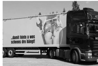
Abb. 23: LKW der Spedition Hotz, 2021