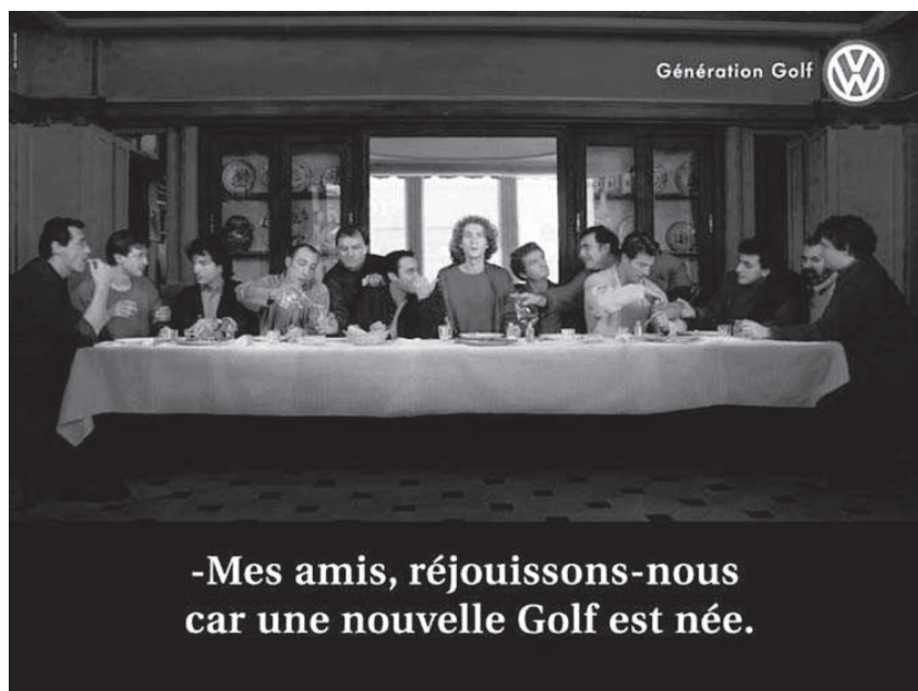
Abb. 8: Volkswagen, Frankreich, 1998

Lingenfelder spricht diesbezüglich von einem „Vorhandensein [...] interkultureller Divergenzen“ und einem „positiven [sowie] negativen Herkunftsländereffekt“. 654 Danach müssten Werbetreibende sich der unterschiedlichen Bedeutungen etwa von „Zeichen, Farben, Symbolen und Wörtern“ bewusst sein und ihre Werbebotschaften gegebenenfalls national anpassen. Insbesondere Werbung mit Humor und Aussagen, die an das traditionelle Rollenverständnis von Männern und Frauen anknüpfen würden, würden in den verschiedenen Ländern Europas unterschiedlich bewertet werden. 655