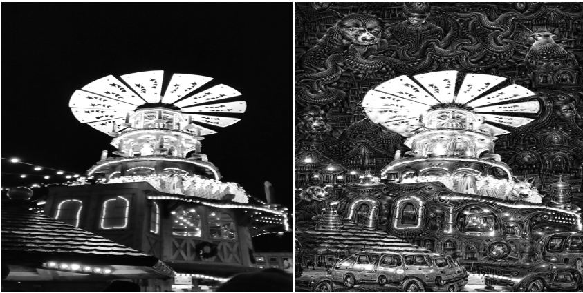
Abbildung 10.2: DeepDream – Links: Input, Rechts: Output.

die DeepDream als Webanwendung zur Verfügung stellen. 510 Dort kann ein Benutzer ein eigenes Bild hochladen, und bekommt wenig später den Output von DeepDream zurück.