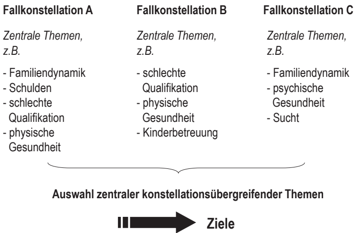
Schaubild 7: Entwicklung generativer Themen und eines Zielsystems

len gar nicht oder nur am Rand vorkommen, sich aber z. B. über Ergebnisse von Jugendhilfeplanung oder Sozialplanung zeigen, z. B. ein hohes Mietniveau, die soziale oder demografische Struktur eines Stadtteils. Denn die Arbeit an Einzelfällen darf nicht zu dem systematischen Fehlschluss führen, „Fälle“ zum Ausgangspunkt von Planungen zu machen, gleichzeitig aber die strukturellen Lebensbedingungen dann auszublenden, wenn sie in den typischen „Fällen“ nicht thematisiert werden. Zwischen den Themen aus typischen „Fällen“ und den thematisierbaren strukturellen Bedingungen kann, aber muss nicht, eine Schnittmenge bestehen. Deshalb muss die klassische, an Strukturen ansetzende Planungsperspektive auch in die Planungskonferenzen hereingenommen werden. Resultat dieser Arbeit ist ein Themengerüst, das den Ausgangspunkt für gemeinsame Planungen darstellt. Allerdings ist zu beachten, dass der Fokus auf die Nutzenden erhalten bleibt und dieser Fokus auch für die nächsten Planungsschritte maßgeblich ist (vgl. Schaubild 7). Auf der Grundlage dieses Themengerüsts, das über die Diskussion typischer „Fälle“ und einschlägiger Ergebnisse aus Sozialplanung und Sozialberichterstattung entwickelt wurde, wird von den am Netzwerk beteiligten Akteuren ein gemeinsames Zielsystem erarbeitet, das den Rahmen für weitere strategische und operative Planungen darstellt. Hierzu können Methoden und Instrumente des Projektmanagements genutzt werden.