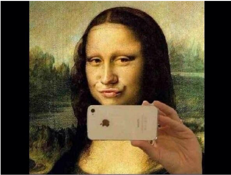
Abb. 11.: Mona Lisa Selfie Montage, o.A.

Dies soll durch eine Auswahl unterschiedlicher Beispiele verdeutlicht werden. Die „Mona Lisa“ (1503–1506) von Leonardo da Vinci – als das bekannteste Gemälde der Welt – wird im Internet häufig abgewandelt und verfremdet. Eine bekannte Montage zeigt sie mit dem typischen Selfie Kussmund („Duckface“) und mit einem Handy in der Hand. 236 Sie wird verschleiert oder in traditioneller Kleidung anderer Kulturen gezeigt, sie bekommt Tattoos, sie wird mit Lego-Steinen oder einer Barbiepuppe nachgebaut, ihr Gesicht wird ersetzt durch Gesichter von Mr. Bean oder Barack Obama. 237 Auch der „Schrei“ (1893) von Edvard Munch wird im Internet für immer neue Montagen genutzt: So gibt es ihn als Kürbis zu sehen, aus Pappe oder Lego und mit Figuren der Serie Simpsons. 238 Die Seite „Classical Art Memes“ 239 zeigt Memes bekannter Kunstwerke, die durch digitale