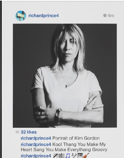
Abb. 8.2.: Richard Prince, Print der Reihe „New Portraits“, 2014.