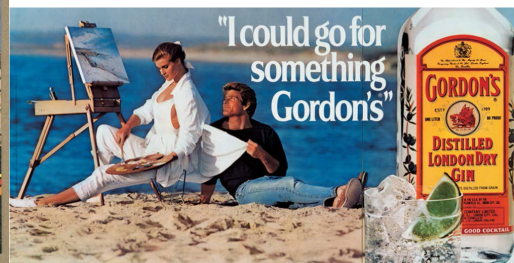
Abb. 4.2.: Jeff Koons, „I could go for something Gordon's“, 1986.