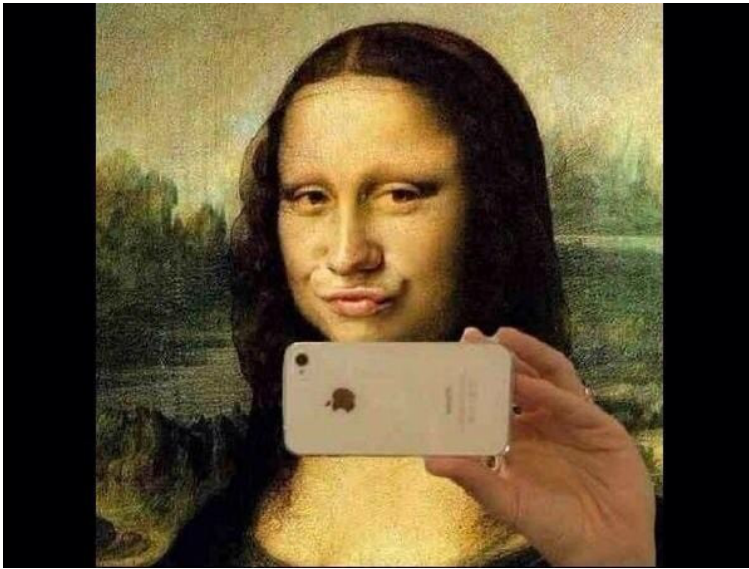
Abb. 11.: Mona Lisa Selfie Montage, o.A.

Dies soll durch eine Auswahl unterschiedlicher Beispiele verdeutlicht werden. Die „Mona Lisa“ (1503–1506) von Leonardo da Vinci – als das bekannteste Gemälde der Welt – wird im Internet häufig abgewandelt und verfremdet. Eine bekannte Montage zeigt sie mit dem typischen Selfie Kussmund („Duckface“) und mit einem Handy in der Hand. 236 Sie wird verschleiert oder in traditioneller Kleidung anderer Kulturen gezeigt, sie bekommt Tattoos, sie wird mit Lego-Steinen oder einer Barbiepuppe nachgebaut, ihr Gesicht wird ersetzt durch Gesichter von Mr. Bean oder Barack Obama. 237 Auch der „Schrei“ (1893) von Edvard Munch wird im Internet für immer neue Montagen genutzt: So gibt es ihn als Kürbis zu sehen, aus Pappe oder Lego und mit Figuren der Serie Simpsons. 238 Die Seite „Classical Art Memes“ 239 zeigt Memes bekannter Kunstwerke, die durch digitale