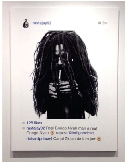
Abb. 5.2.: Richard Prince, Print der „New Portraits“ Reihe, 2014.

setzt. 6 Mit der „New Portraits“ Reihe und mehreren diesbezüglich anhängigen Klagen stellt sich die Frage nach der urheberrechtlichen Zulässigkeit der Appropriation Art neu. Doch nicht nur die Klagen tragen zur erneuten Relevanz dieser Fragestellungen bei, sondern vor allem die veränderte Ausprägung der Appropriation Art: Richard Prince ahmt nun die gängigen Mechanismen der sozialen Netzwerke nach und bringt sie in den Kunstkontext ein. Die Appropriation Art erhebt damit nicht mehr das Kopieren und Transformieren zu einem künstlerischen Prozess, sondern imitiert das alltägliche Kopieren und Transformieren im Internet. Bisher nie dagewesene Möglichkeiten, ein Original ohne Qualitätsverlust mit minimalem Zeitaufwand zu kopieren, haben die Techniken der Appropriation Art demokratisiert und durch die Partizipationskultur im Internet 7 jedermann daran teilhaben lassen. Die Fragen der Collage, des Remix und Sampling in