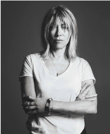
Abb. 8.1.: Eric McNatt, Fotografie von Kim Gordon, 2014.