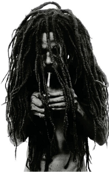
Abb. 5.1.: Donald Graham, „Rastafarian smoking a joint“, 1996.