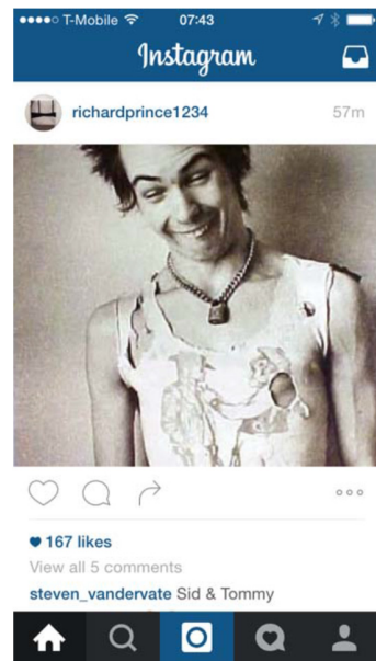
Abb. 6.2.: Richard Prince, Post auf seiner Instagram Seite, 2014.