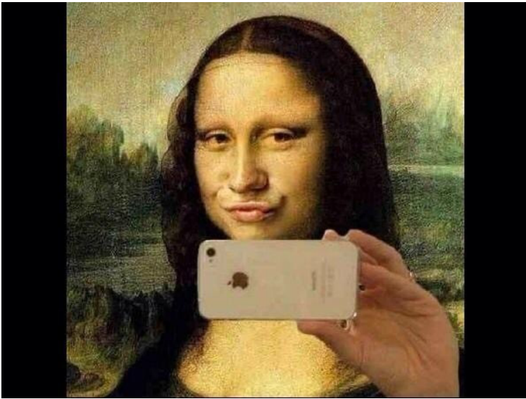
Abb. 11.: Mona Lisa Selfie Montage

Dies soll durch eine Auswahl unterschiedlicher Beispiele verdeutlicht werden. Die „Mona Lisa“ (1503–1506) von Leonardo da Vinci – als das bekannteste Gemälde der Welt – wird im Internet häufig abgewandelt und verfremdet. Eine bekannte Montage zeigt sie mit dem typischen Selfie Kussmund („Duckface“) und mit einem Handy in der Hand. 236 Sie wird verschleiert oder in traditioneller Kleidung anderer Kulturen gezeigt, sie bekommt Tattoos, sie wird mit Lego-Steinen oder einer Barbiepuppe nachgebaut, ihr Gesicht wird ersetzt durch Gesichter von Mr. Bean oder Barack Obama. 237 Auch der „Schrei“ (1893) von Edvard Munch wird im Internet für immer neue Montagen genutzt: So gibt es ihn als Kürbis zu sehen, aus Pappe oder Lego und mit Figuren der Serie Simpsons. 238 Die Seite „Classical Art Memes“ 239 zeigt Memes bekannter Kunstwerke, die durch digitale