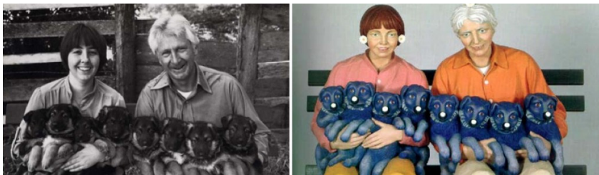
Abb 1.1.: Art Rogers, „Puppies“, 1985. Abb. 1.2.: Jeff Koons, „String of Puppies“, 1988.

In Rogers v. Koons ging es um die Skulptur „String of Puppies“ (1988) von Jeff Koons. 154 Das verwendete Motiv basierte auf einem Schwarzweißfoto von Art Rogers („Puppies“, 1985) 155 , das als Postkarte verkauft wurde. Dieses zweidimensionale Foto verwandelte Koons in eine dreidimensionale Skulptur. Koons hat wie auf dem Foto ein Ehepaar auf einer Bank mit Hundewelpen in dem Armen dargestellt. Die Skulptur weicht von der Vorlage nur in der Farbgebung, der starren Mimik und durch die hinzugefügten Gänseblümchen auf den Köpfen der Personen ab.