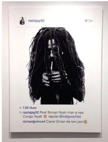
Abb. 5.2.: Richard Prince, Print der „New Portraits“ Reihe, 2014.

setzt. 6 Mit der „New Portraits“ Reihe und mehreren diesbezüglich anhängigen Klagen stellt sich die Frage nach der urheberrechtlichen Zulässigkeit der Appropriation Art neu. Doch nicht nur die Klagen tragen zur erneuten Relevanz dieser Fragestellungen bei, sondern vor allem die veränderte Ausprägung der Appropriation Art: Richard Prince ahmt nun die gängigen Mechanismen der sozialen Netzwerke nach und bringt sie in den Kunstkontext ein. Die Appropriation Art erhebt damit nicht mehr das Kopieren und Transformieren zu einem künstlerischen Prozess, sondern imitiert das alltägliche Kopieren und Transformieren im Internet. Bisher nie dagewesene Möglichkeiten, ein Original ohne Qualitätsverlust mit minimalem Zeitaufwand zu kopieren, haben die Techniken der Appropriation Art demokratisiert und durch die Partizipationskultur im Internet 7 jedermann daran teilhaben lassen. Die Fragen der Collage, des Remix und Sampling in