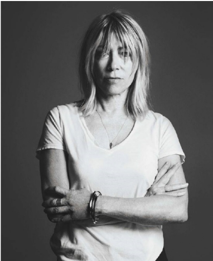
Abb. 8.1.: Eric McNatt, Fotografie von Kim Gordon, 2014.