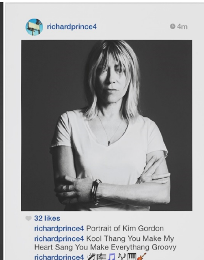
Abb. 8.2.: Richard Prince, Print der Reihe „New Portraits“, 2014.