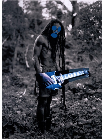
Abb. 3.2.: Richard Prince, „Graduation“, 2008.