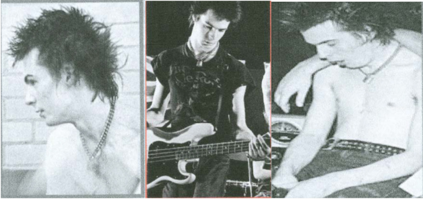
Abb. 6.3.: Dennis Morris, Fotos von Sid Vicious, 1970er.