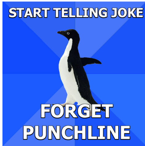
Abb. 10.2.: ein Beispiel des Meme „Socially Awkward Penguin“, o.A.

Parodie oder Hommage vorliegen. 230 Mit jeder neuen Bild-Text-Kombination eines neu erstellten Memes kann zudem von einem Original gesprochen werden.