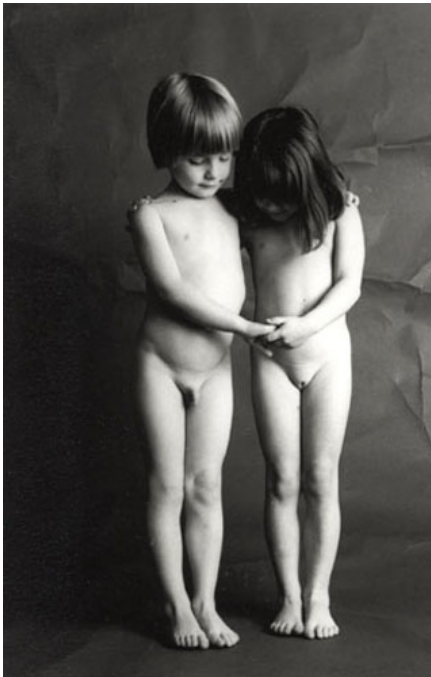
Abb. 9.1.: Jean-François Bauret, „Enfants“, 1970.

schuf eine Porzellanskulptur zweier nackter Kinder, „Naked“ (1988) 193 , wobei sich hier die Kinder nicht mehr an den Händen halten, sondern der Junge dem Mädchen eine Blume reicht und die beiden auf einer herzförmigen Sockelplatte verziert mit Blumen stehen. Durch die glasierte Porzellanoberfläche glänzen die Körper. Wo es bei Bauret noch Kinder in inniger Zweisamkeit zeigt, die Reinheit und Unschuld ausstrahlen, ist die Szene bei Koons sexuell aufgeladen und kitschig. Die „Naked“-Skulptur sollte ursprünglich im Centre Pompidou Paris bei einer Retrospektive gezeigt werden, ist aber wohl beim Transport nach Paris zerstört worden. 194 Eine Abbildung der Skulptur war jedoch im Ausstellungskatalog abgedruckt und wurde auf Koons Webseite gezeigt.