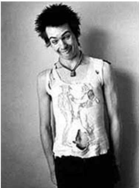
Abb. 6.1.: Dennis Morris, Foto von Sid Vicious, 1970er.

Dennis Morris verklagte Richard Prince am 03.06.2016. 182 Morris Foto des Sex Pistols Musikers Sid Vicious 183 hat Prince abfotografiert und auf seinem eigenen Instagram-Account geteilt. 184 Weiterhin hat Prince einige weitere Bilder von Sid Vicious, die Morris fotografierte 185 , für seine Ausstellung „Covering Pollock“ 2011 genutzt, 186 ohne Einwilligung von Morris. Hier stellen sich also ähnliche Fragen des Transformative Use wie bei Graham v. Prince . Die Klage von Morris wurde am 12.08.2016 zurückgenommen, es wurde wohl ein außergerichtlicher Vergleich geschlossen. 187