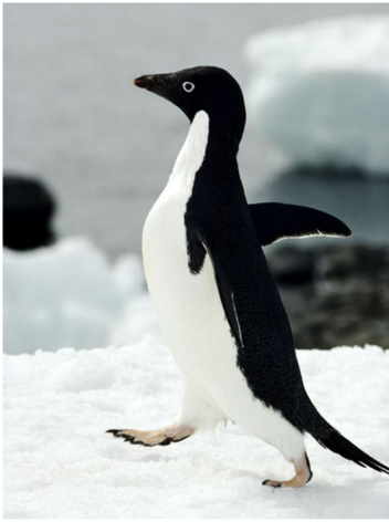
Abb. 10.1.: George F. Mobley/Getty Images, Fotografie, 2009.