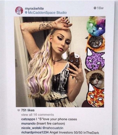
Abb. 7.2.: Richard Prince, Print der Reihe „New Portraits“, 2014.

Die Klage von Eric McNatt vom 16.11.2016 gegen die Nutzung seiner Fotografie in der Reihe „New Portraits“ von Prince ist weiterhin anhängig und wurde noch nicht entschieden. 190