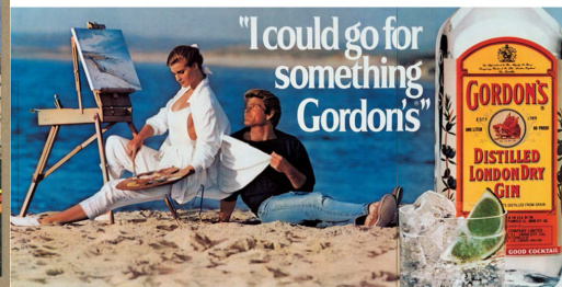
Abb. 4.2.: Jeff Koons, „I could go for something Gordon's“, 1986.