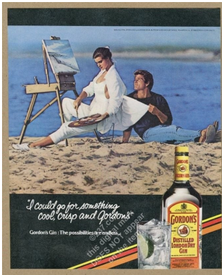
Abb. 4.1.: Gordon's Werbung, 1980er.

das Glas und den Slogan von Gordon's Gin. Auch deren Platzierung auf dem Foto und die Schriftart wurden verändert. Koons produzierte davon zwei Gemälde und ein Artist's Proof (Probedruck). Der Artist's Proof von Koons wurde 2008 für 1.028.500 GBP verkauft. Es kam aber im April 2016 zu einem Vergleich zwischen Gray und Koons, sodass der Fall nicht gerichtlich entschieden wurde. 172