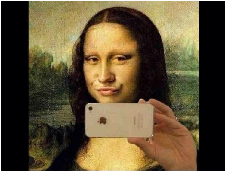
Abb. 11.: Mona Lisa Selfie Montage, o.A.

Dies soll durch eine Auswahl unterschiedlicher Beispiele verdeutlicht werden. Die „Mona Lisa“ (1503–1506) von Leonardo da Vinci – als das bekannteste Gemälde der Welt – wird im Internet häufig abgewandelt und verfremdet. Eine bekannte Montage zeigt sie mit dem typischen Selfie Kussmund („Duckface“) und mit einem Handy in der Hand. 236 Sie wird verschleiert oder in traditioneller Kleidung anderer Kulturen gezeigt, sie bekommt Tattoos, sie wird mit Lego-Steinen oder einer Barbiepuppe nachgebaut, ihr Gesicht wird ersetzt durch Gesichter von Mr. Bean oder Barack Obama. 237 Auch der „Schrei“ (1893) von Edvard Munch wird im Internet für immer neue Montagen genutzt: So gibt es ihn als Kürbis zu sehen, aus Pappe oder Lego und mit Figuren der Serie Simpsons. 238 Die Seite „Classical Art Memes“ 239 zeigt Memes bekannter Kunstwerke, die durch digitale