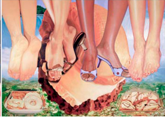
Abb. 2.2.: Jeff Koons, „Niagara“, 2000.