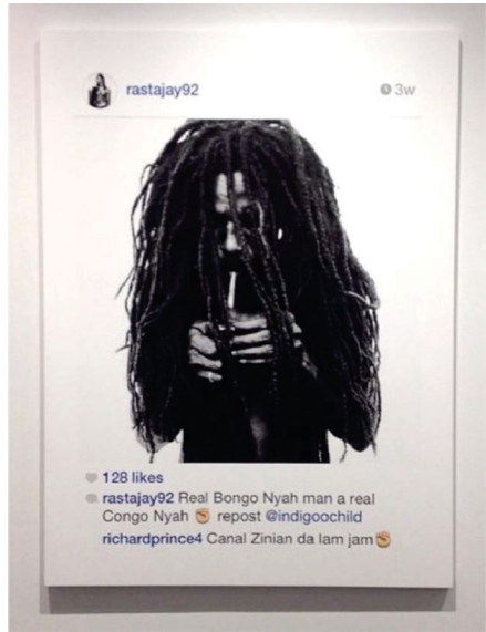
Abb. 5.2.: Richard Prince, Print der „New Portraits“ Reihe, 2014.

setzt. 6 Mit der „New Portraits“ Reihe und mehreren diesbezüglich anhängigen Klagen stellt sich die Frage nach der urheberrechtlichen Zulässigkeit der Appropriation Art neu. Doch nicht nur die Klagen tragen zur erneuten Relevanz dieser Fragestellungen bei, sondern vor allem die veränderte Ausprägung der Appropriation Art: Richard Prince ahmt nun die gängigen Mechanismen der sozialen Netzwerke nach und bringt sie in den Kunstkontext ein. Die Appropriation Art erhebt damit nicht mehr das Kopieren und Transformieren zu einem künstlerischen Prozess, sondern imitiert das alltägliche Kopieren und Transformieren im Internet. Bisher nie dagewesene Möglichkeiten, ein Original ohne Qualitätsverlust mit minimalem Zeitaufwand zu kopieren, haben die Techniken der Appropriation Art demokratisiert und durch die Partizipationskultur im Internet 7 jedermann daran teilhaben lassen. Die Fragen der Collage, des Remix und Sampling in