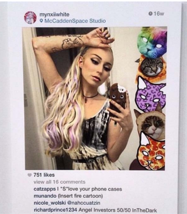
Abb. 7.2.: Richard Prince, Print der Reihe „New Portraits“, 2014.

Die Klage von Eric McNatt vom 16.11.2016 gegen die Nutzung seiner Fotografie in der Reihe „New Portraits“ von Prince ist weiterhin anhängig und wurde noch nicht entschieden. 190