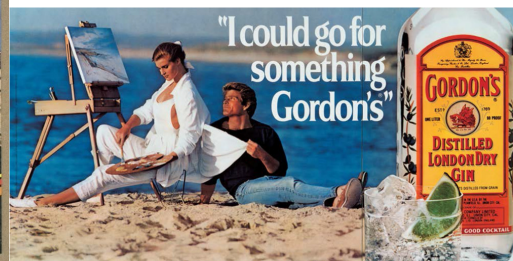
Abb. 4.2.: Jeff Koons, „I could go for something Gordon's“, 1986.