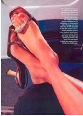
Abb 2.1.: Andrea Blanch, „Silk Sandals by Gucci“, 2000.

gazin arbeitete, schöpfe er ihr keine Gewinne ab und zerstöre auch nicht ihren potenziellen Markt für die Nutzung von „Silk Sandals“. 163