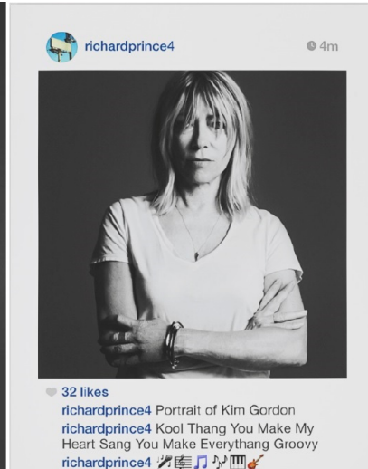
Abb. 8.2.: Richard Prince, Print der Reihe „New Portraits“, 2014.