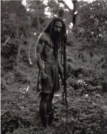
Abb. 3.1.: Patrick Cariou, Fotografie aus dem Buch „Yes Rasta“, 2000, S. 118.

verwiesen. Bevor diese eine Entscheidung treffen konnte, haben sich Prince und Cariou am 18.03.2014 außergerichtlich geeinigt. Die Entscheidung ist deshalb von geringer praktischer Bedeutung, zeigt aber, dass das Gericht an den Grundsätzen aus der Blanch v. Koons -Entscheidung festgehalten haben.