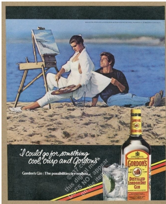
Abb. 4.1.: Gordon's Werbung, 1980er.

das Glas und den Slogan von Gordon's Gin. Auch deren Platzierung auf dem Foto und die Schriftart wurden verändert. Koons produzierte davon zwei Gemälde und ein Artist's Proof (Probedruck). Der Artist's Proof von Koons wurde 2008 für 1.028.500 GBP verkauft. Es kam aber im April 2016 zu einem Vergleich zwischen Gray und Koons, sodass der Fall nicht gerichtlich entschieden wurde. 172