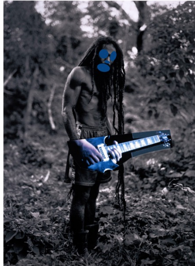
Abb. 3.2.: Richard Prince, „Graduation“, 2008.