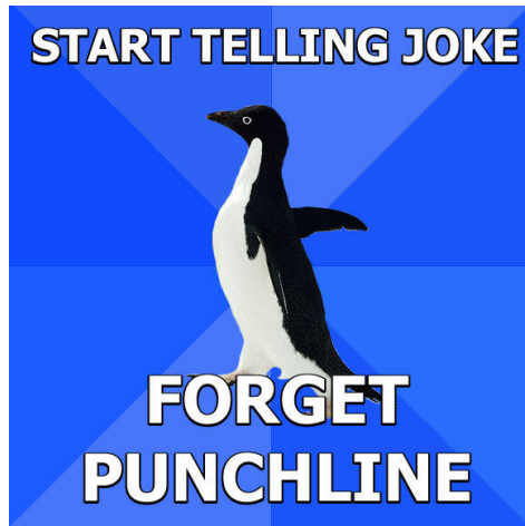
Abb. 10.2.: ein Beispiel des Meme „Socially Awkward Penguin“, o.A.

Parodie oder Hommage vorliegen. 230 Mit jeder neuen Bild-Text-Kombination eines neu erstellten Memes kann zudem von einem Original gesprochen werden.