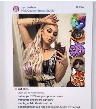
Abb. 7.2.: Richard Prince, Print der Reihe „New Portraits“, 2014.