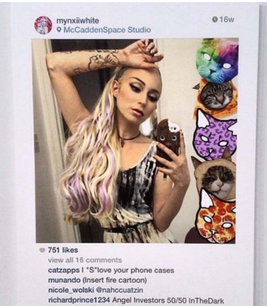
Abb. 7.2.: Richard Prince, Print der Reihe „New Portraits“, 2014.

Die Klage von Eric McNatt vom 16.11.2016 gegen die Nutzung seiner Fotografie in der Reihe „New Portraits“ von Prince ist weiterhin anhängig und wurde noch nicht entschieden. 190