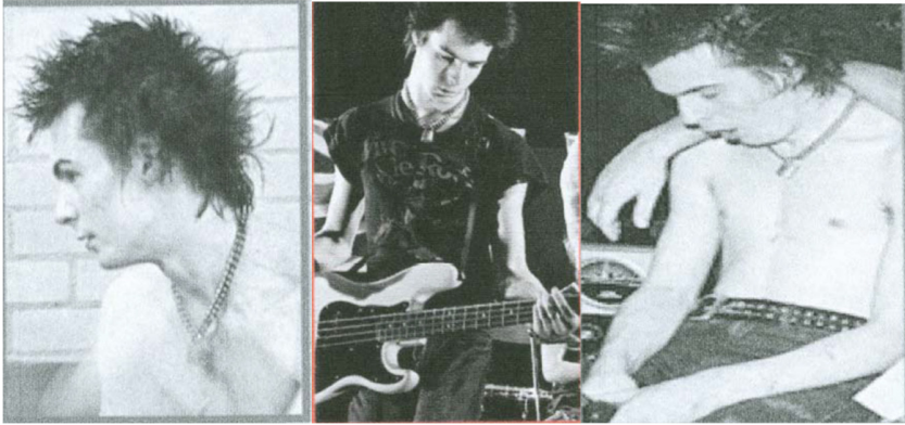
Abb. 6.3.: Dennis Morris, Fotos von Sid Vicious, 1970er.