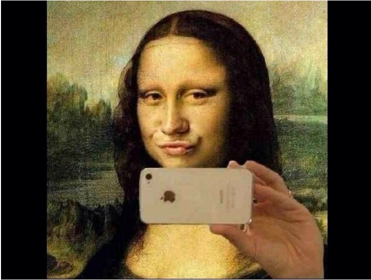
Abb. 11.: Mona Lisa Selfie Montage, o.A.

Dies soll durch eine Auswahl unterschiedlicher Beispiele verdeutlicht werden. Die „Mona Lisa“ (1503–1506) von Leonardo da Vinci – als das bekannteste Gemälde der Welt – wird im Internet häufig abgewandelt und verfremdet. Eine bekannte Montage zeigt sie mit dem typischen Selfie Kussmund („Duckface“) und mit einem Handy in der Hand. 236 Sie wird verschleiert oder in traditioneller Kleidung anderer Kulturen gezeigt, sie bekommt Tattoos, sie wird mit Lego-Steinen oder einer Barbiepuppe nachgebaut, ihr Gesicht wird ersetzt durch Gesichter von Mr. Bean oder Barack Obama. 237 Auch der „Schrei“ (1893) von Edvard Munch wird im Internet für immer neue Montagen genutzt: So gibt es ihn als Kürbis zu sehen, aus Pappe oder Lego und mit Figuren der Serie Simpsons. 238 Die Seite „Classical Art Memes“ 239 zeigt Memes bekannter Kunstwerke, die durch digitale