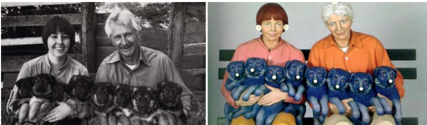
Abb 1.1.: Art Rogers, „Puppies“, 1985. Abb. 1.2.: Jeff Koons, „String of Puppies“, 1988.

In Rogers v. Koons ging es um die Skulptur „String of Puppies“ (1988) von Jeff Koons. 154 Das verwendete Motiv basierte auf einem Schwarzweißfoto von Art Rogers („Puppies“, 1985) 155 , das als Postkarte verkauft wurde. Dieses zweidimensionale Foto verwandelte Koons in eine dreidimensionale Skulptur. Koons hat wie auf dem Foto ein Ehepaar auf einer Bank mit Hundewelpen in dem Armen dargestellt. Die Skulptur weicht von der Vorlage nur in der Farbgebung, der starren Mimik und durch die hinzugefügten Gänseblümchen auf den Köpfen der Personen ab.