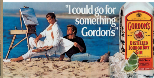
Abb. 4.2.: Jeff Koons, „I could go for something Gordon's“, 1986.