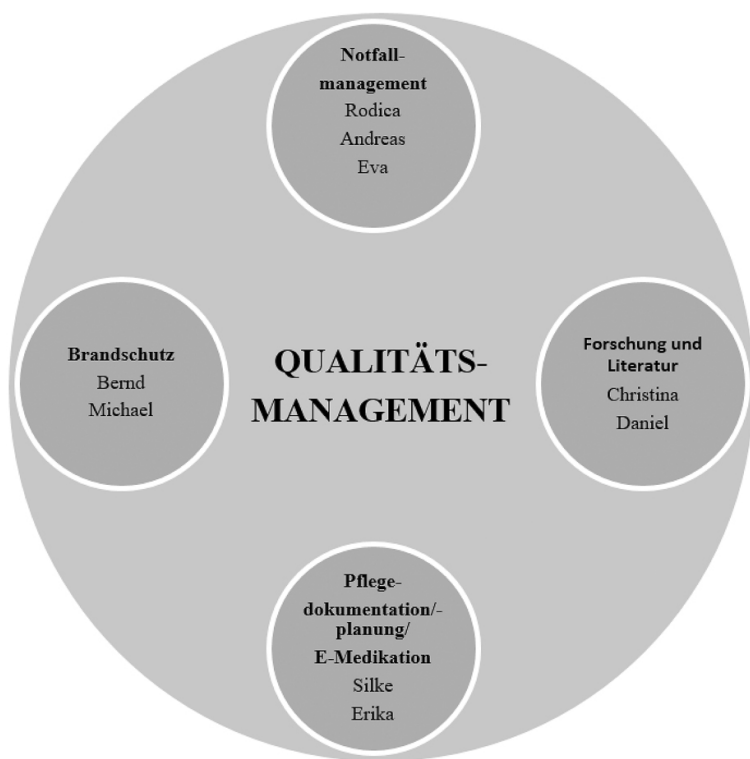
Abb. 3: Qualitätsmanagement-Kreis (Hobensinner)

So wurde innerhalb dieser Verantwortungsbereiche zum Beispiel ein Kreis für das Qualitätsmanagement gebildet. Innerhalb dieses Qualitätsmanagement-Kreises gibt es kleinere Kreise mit Themenbereichen, die im Zuge des Qualitätsmanagements bearbeitet werden. Die Verantwortung für jeden dieser Kreise obliegt mehreren Personen. Ziele, Strategien, die Koordination oder auch die Moderation der Treffen werden zusammen entschieden. Zusätzlich wird der Kreis auch für Mitarbeitergespräche, Team- und Führungcoachings, Supervisionen sowie Teambegleitungen durch Mentorinnen und Mentoren genutzt.