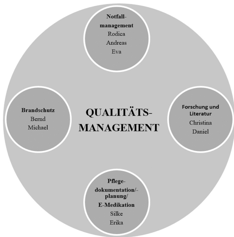
Abb. 3: Qualitätsmanagement-Kreis (Hobensinner)

So wurde innerhalb dieser Verantwortungsbereiche zum Beispiel ein Kreis für das Qualitätsmanagement gebildet. Innerhalb dieses Qualitätsmanagement-Kreises gibt es kleinere Kreise mit Themenbereichen, die im Zuge des Qualitätsmanagements bearbeitet werden. Die Verantwortung für jeden dieser Kreise obliegt mehreren Personen. Ziele, Strategien, die Koordination oder auch die Moderation der Treffen werden zusammen entschieden. Zusätzlich wird der Kreis auch für Mitarbeitergespräche, Team- und Führungcoachings, Supervisionen sowie Teambegleitungen durch Mentorinnen und Mentoren genutzt.