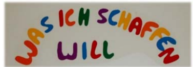
Abb. 6, 7 und 8: Transparenz im Alltag (Traumapädagogisches Team KJP Graz, 2016)