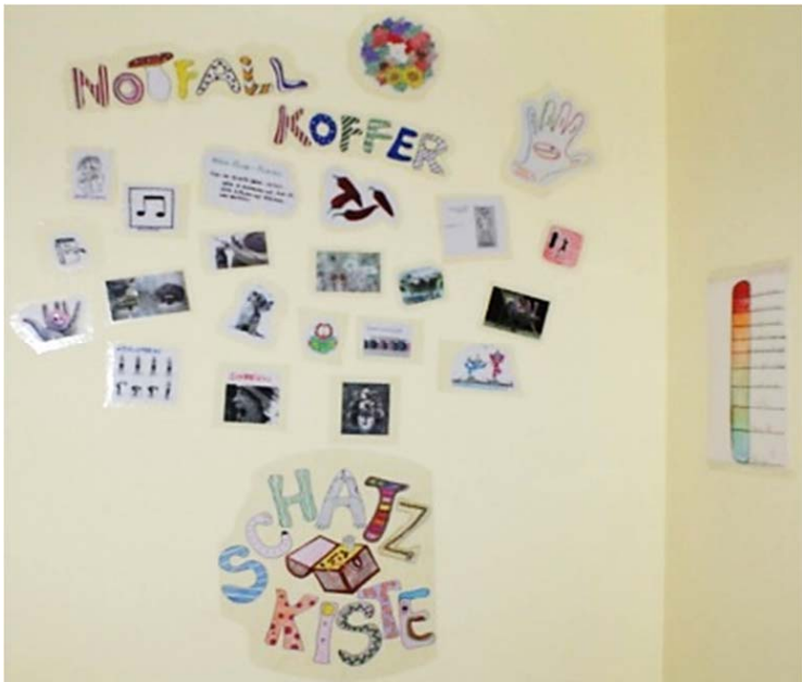
Abb. 4 und 5: Notfallkoffer (Traumapädagogisches Team KJP Graz, 2016)