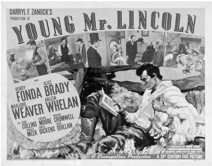
Abbildung 1: Historisches, im Original vierfarbiges, Werbematerial für den Film „Young Mr. Lincoln“ (USA 1939). Man sieht den späteren US-Präsidenten u.a. auf dem Zentralbild als strammen Jüngling beim Studium des Common Law, beim Schlichten eines Nachbarschaftstreits im zweiten kleinen Bild von links, und schließlich als Anwalt vor Gericht und wie er ganz allein einen Lynchmob aufhält auf dem Bilderreigen rechts. http://www.cliomuse.com/young-mr-lincoln-1939.html , zuletzt aufgerufen am 28. 02. 2017.

deutschen Fernsehrichterinnen und -richter mehr demonstrative Fairness für die Betroffenen, die vor der Richterbank auftraten. 28