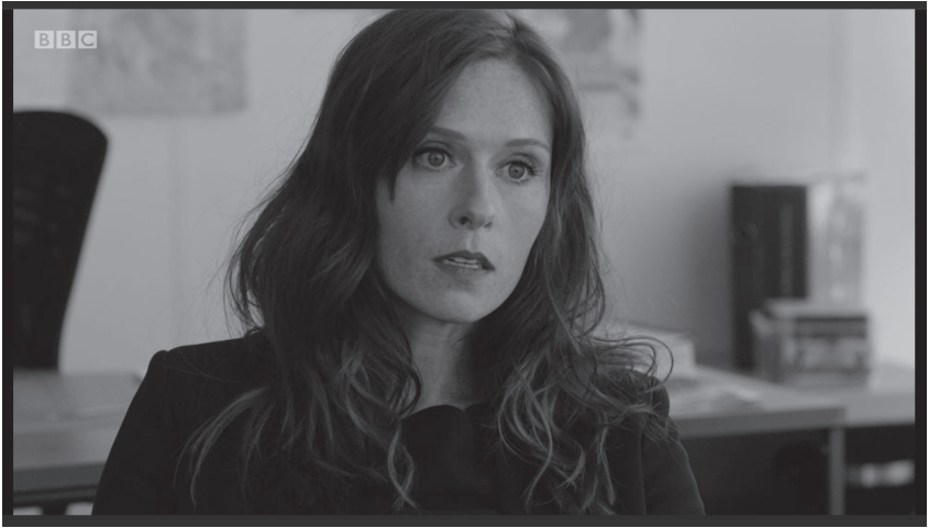
Abbildung 2: Anwältin Joséphine Karlsson (gespielt von Audrey Fleurot) beginnt ein Doppelspiel im Dienst von und gegen organisierte Kriminelle. In dieser Szene hat sie einen korrupten Unternehmer dazu gebracht, den Übergriff der zwei Hauptpersonen der Serie auf ihren Mandanten anzuzeigen. Filmstill von „Engrenages“, Serie 7, Folge 9 (Frankreich 2019). Screenshot des Autors vom BBC i-player, 4. 12. 2019.