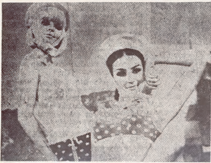
Abb. 4: Sigmar Polke, Freundinnen I , 1967, Offsetdruck auf Karton, 47,9 x 60,8 cm, Kupferstichkabinett Berlin