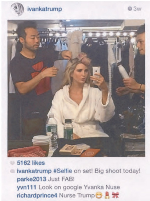
Abb. 6: Richard Prince, Untitled (portrait) , Tintenstrahlruck auf Leinwand, 167,0 x 123,8 cm, Sammlung Ivanka Trump, New York

behaupten, dass ein erworbenes Bild eine Fälschung sei, nur weil ihm aus politischen Gründen die Käuferin nicht genehm ist. Deshalb bezeichnet der Kunstkritiker Jonathan Jones die ganze Aktion als „Witz“ und „post-modernen Spaß“. 41 Für Prince war sie jedoch durchaus eine sehr ernste, weil eben politische Angelegenheit, auch wenn sein Protest nur eine symbolische und keine kunstrechtliche Bedeutung haben kann. Letztendlich lässt sich in diesem außergewöhnlichen Vorgehen von Richard Prince auch ein Versuch zur Beantwortung der schwierigen Frage sehen, wie heutige Künstler und Künstlerinnen auf Donald Trump und seine Familie angemessen und wirksam reagieren können, wie sich also Kritik und Protest in künstlerischer Form effektiv vermitteln lassen. Prince jedenfalls hat mit seiner Behauptung einer Fälschung und den nachfolgenden Erklärun-