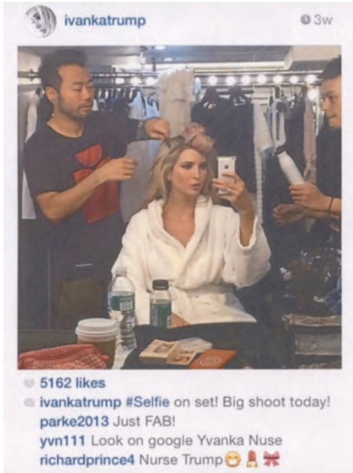
Abb. 6: Richard Prince, Untitled (portrait) , Tintenstrahlruck auf Leinwand, 167,0 x 123,8 cm, Sammlung Ivanka Trump, New York

behaupten, dass ein erworbenes Bild eine Fälschung sei, nur weil ihm aus politischen Gründen die Käuferin nicht genehm ist. Deshalb bezeichnet der Kunstkritiker Jonathan Jones die ganze Aktion als „Witz“ und „post-modernen Spaß“. 41 Für Prince war sie jedoch durchaus eine sehr ernste, weil eben politische Angelegenheit, auch wenn sein Protest nur eine symbolische und keine kunstrechtliche Bedeutung haben kann. Letztendlich lässt sich in diesem außergewöhnlichen Vorgehen von Richard Prince auch ein Versuch zur Beantwortung der schwierigen Frage sehen, wie heutige Künstler und Künstlerinnen auf Donald Trump und seine Familie angemessen und wirksam reagieren können, wie sich also Kritik und Protest in künstlerischer Form effektiv vermitteln lassen. Prince jedenfalls hat mit seiner Behauptung einer Fälschung und den nachfolgenden Erklärun-