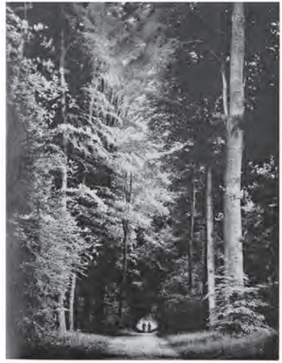
TAFEL V So sieht der Waldweg heute aus, den die Geschwister Hänsel und Gretel im Jahre 1642 gegangen sind. Trotz der Veränderungen, die die Zeit geschaffen hat, erkannte Osszeg ihn wieder. Die beiden Figuren dienen dazu, die Größenverhältnisse zu verdeutlichen.