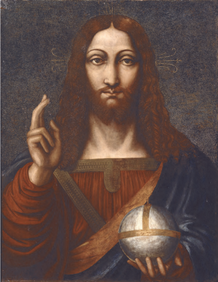
Abb. 3: Unbekannter Mailänder Künstler: Christus als Salvator Mundi (erste Hälfte 16. Jh.), Accademia Carrara, Bergamo

demia Carrara in Bergamo befindet und dort einem „pittore milanese“ zugeschrieben wird (Abb. 3). 36