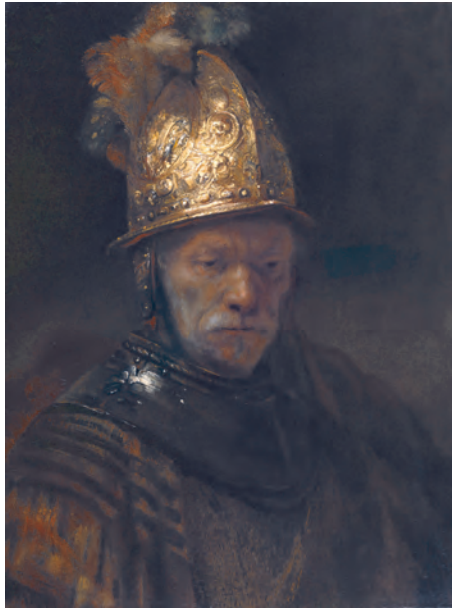
Abb. 4: Künstler aus dem Umkreis Rembrandts: Der Mann mit dem Goldhelm (um 1650/55), Gemäldegalerie, Staatliche Museen zu Berlin

Ein etwas komplexeres Beispiel stellt der Mann mit dem Goldhelm dar. Generationen waren seit dem Ankauf für das Berliner Kaiser-Friedrich-Museum 1897 in dem Wissen aufgewachsen, es handle sich um ein Werk Rembrandts ( Abb. 4 ). 49