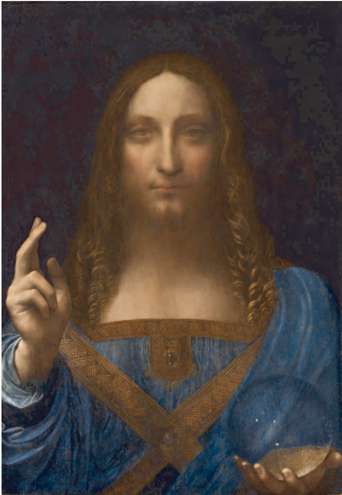
Abb. 2: Leonardo da Vinci und Werkstatt (zugeschrieben): Christus als Salvator Mundi (nach 1507?), Privatsammlung

rungsortes abgesehen gibt es nicht einmal hinreichendes Vertrauen in die Person und Identifikation des derzeitigen Eigentümers. 25