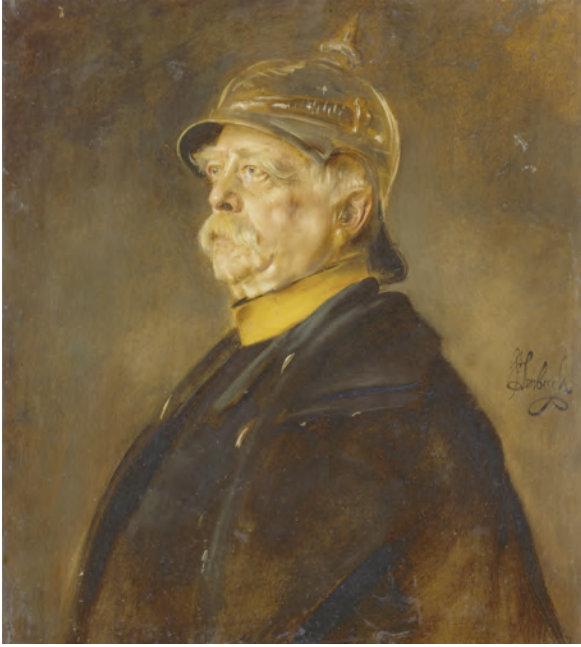
Abb. 5: Franz von Lenbach: Otto Fürst von Bismarck (um 1900), Bayerische Staatsgemäldesammlungen, München

Die Erwartungshaltung war womöglich auch durch die Präsenz eines anderen Helmträgers beeinflusst. Martin Warnke hat auf die Ähnlichkeit mit den ubiquitären Bismarckportraits Lenbachs (Abb. 5) erhellend hingewiesen. 50