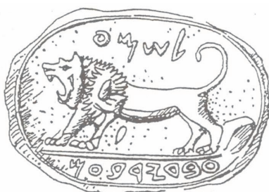
Abb. 2: Zweiregistriges Stempelsiegel aus Megiddo (8. Jh. v. Chr.) zeigt einen brüllenden Löwen mit erhobenem Schwanz. Die Inschrift nennt den Besitzer des Siegels „Schema, Diener [Minister] Jerobeams (II)“.

Für das Verhältnis Mensch-Tier ist im Alten Testament eine kategoriale Unterscheidung leitend, die in der tierethischen Diskussion bisweilen schon als anthropozentrisch kritisiert wird (vgl. Friederike Schmitz 2014, 13-76): die Unterscheidung in wild lebende Tiere (hebr. ḥajjat hasādāh ) und Haus- und Nutztiere (hebr. b e hemāh ).