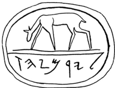
Abb. 1: Zweiregistriges Stempelsiegel aus Juda (8. Jh. v. Chr.) zeigt eine äsende Hirschkuh; darunter der Name des Besitzers: Dem Yirmeyahu (gehörig).

Texte der Bibel auf, vom Floh, der Motte und Ameise bis hin zum Geier, Bären, Hirschen, Löwen und Panther. 5 Und auch ikonographische Zeugnisse der Levante (s. Abb. 1 und 2) führen uns vor Augen, wie vielfältig und artenreich die Fauna des antiken Palästina/Israel war. 6