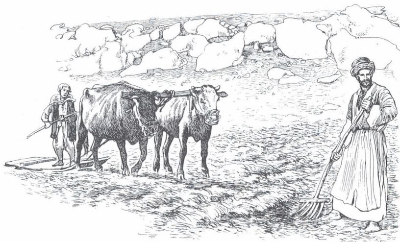
Abb. 5: Diese Zeichnung gibt den Dreschvorgang im 20. Jahrhundert n. Chr. wieder, entspricht aber der alttestamentlichen Zeit: Rinder zogen einen einfachen Dreschschlitten, der tagelang über das geerntete Getreide fuhr: Durch die an der Unterseite des Dreschschlittens eingelassenen Flintsteine lösten sich allmählich die Körner aus den Ähren.

deihen (vgl. Ps 144,12-14). Es nimmt daher nicht wunder, dass in weisheitlichen Texten und vor allem alten Rechtsbestimmungen, die dezidiert auf die Lebenswirklichkeit der Menschen ausgerichtet sind, das Verhältnis Mensch-Tier in den Blick rückt. Diese Texte sollen jetzt betrachtet werden.