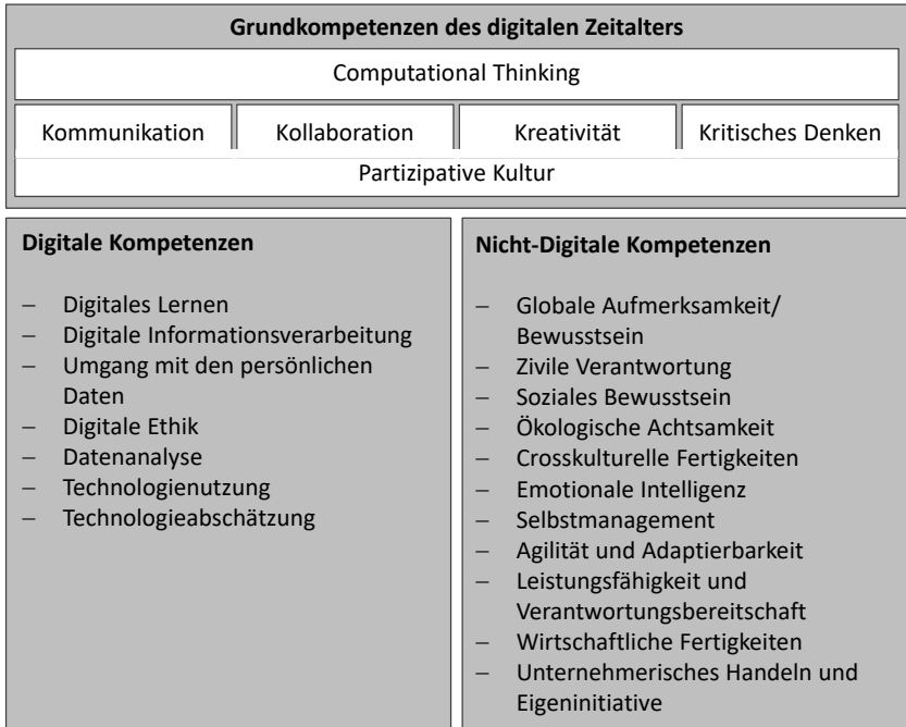
Abbildung 2: Kompetenzset des digitalen Zeitalters

Zu den digitalen Kompetenzen gehören Fähigkeiten einer digital getriebenen Wissensgenerierung, wie sie beispielsweise durch die Möglichkeiten des E-Learnings umsetzbar werden. 81 Es ist die individuelle Fähigkeit, Informationen finden, bewerten und verarbeiten zu können, durch die multimediale Nutzung von Technologien. Diese Fertigkeit wird oft auch als „Digital Literacy“ 82 , oder „Media Literacy“ 83 bezeichnet. Digitale Kompetenzen umfassen aber auch Kenntnisse im sicheren und datenschützenden Umgang mit der eigenen Privatsphäre im Internet, speziell im Umgang mit den digitalen Spuren bzw. der persönlichen digitalen DNS 84 sowie eine ethische Bewertung digitaler Lösungen