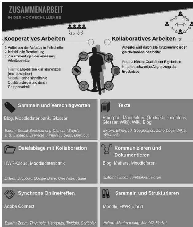
Abbildung 2: Tools und Techniken zur Zusammenarbeit am Beispiel der HWR, E-Learning-Team der HWR (2019)

Bei genauerer Betrachtung sind es deshalb zwei Dimensionen, die den Optionenraum für die Gestaltung von Blended-Learning-Aktivitäten beschreiben: erstens die technologische Dimension und zweitens die didaktische Dimension.