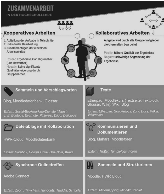
Abbildung 2: Tools und Techniken zur Zusammenarbeit am Beispiel der HWR, E-Learning-Team der HWR (2019)

Bei genauerer Betrachtung sind es deshalb zwei Dimensionen, die den Optionenraum für die Gestaltung von Blended-Learning-Aktivitäten beschreiben: erstens die technologische Dimension und zweitens die didaktische Dimension.