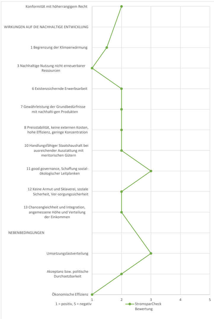
Abbildung 17: Profilliniendiagramm zum Stromspar-Check.