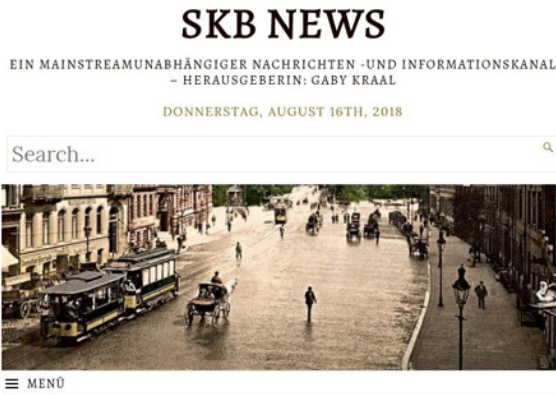
Abbildung 2.4: Populistische Fake News mit starkem Gegensatz Volk-Elite