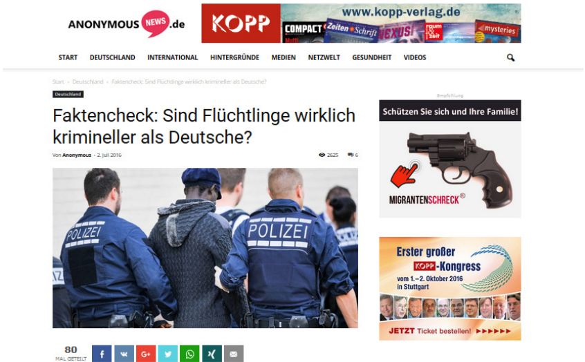
Abbildung 2.1: Werbung für Waffen und den Kopp-Verlag auf anonymous-news.ru

Waffenhandel nutzte (siehe Abb. 2.1). Dennoch zeigt der Fall: Im deutschsprachigen Internet ermöglichen Fake News perfide Geschäftsmodelle.