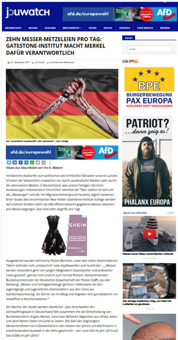
Abbildung 2.3: Anti-Elitenpopulismus in Fake News zu Migration und Kriminalität