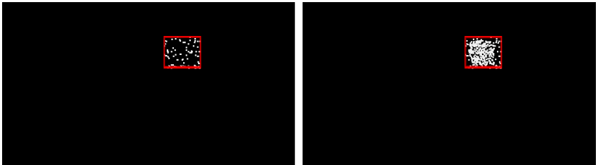
Abbildung 4.5: links: Detektionsergebnis für original Video-Frame, rechts: für Deepfake-Mainpulation

Im folgenden Bildpaar ist hierfür das Detektionsergebnis zu sehen. Man kann erkennen, dass die als Fälschung signalisierten Pixel im tatsächlich manipulierten Bild (rechts) viel dichter liegen als im unverfälschten Original-Frame (links). Durch geeignete Wahl eines Schwellwerts für diese Dichte wird eine eindeutige Klassifikation möglich.