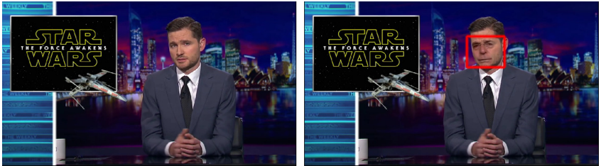
Abbildung 4.4: links: originaler Video-Frame; rechts: Deepfake-Manipulation und Gesichtserkennung (rot)

Im folgenden Bildpaar ist hierfür das Detektionsergebnis zu sehen. Man kann erkennen, dass die als Fälschung signalisierten Pixel im tatsächlich manipulierten Bild (rechts) viel dichter liegen als im unverfälschten Original-Frame (links). Durch geeignete Wahl eines Schwellwerts für diese Dichte wird eine eindeutige Klassifikation möglich.