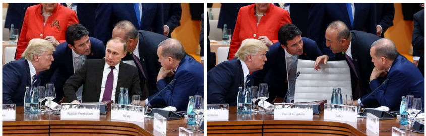
Abbildung 4.2: Ein Beispiel für eine Montage. Links findet sich die Fälschung, in der Putin auf den leeren Stuhl im Bild auf der rechten Seite einkopiert wurde.

Eingangsbild in ein zweites Eingangsbild kopiert wird. So kann ein Ausgangsbild erzeugt werden, welches zum Beispiel die Person fälschlicherweise in einer Situation darstellt, die die Aussage einer ebenfalls dazu erfundenen Falschnachricht untermauert, um die Person zu diffamieren. Es ist aber auch genau das Gegenteil möglich, um zum Beispiel eine Person in einer Situation wichtig erscheinen zu lassen. Eine Fotomontage muss sich jedoch nicht nur auf das Kopieren von Fremdbildinhalten beschränken. So kann der Ersteller der Montage zusätzlich noch bestimmte Bildmanipulationen durchführen, um so das Ausgangsbild authentischer wirken zu lassen oder aber auch, um einer automatisierten Erkennung zu entgehen.