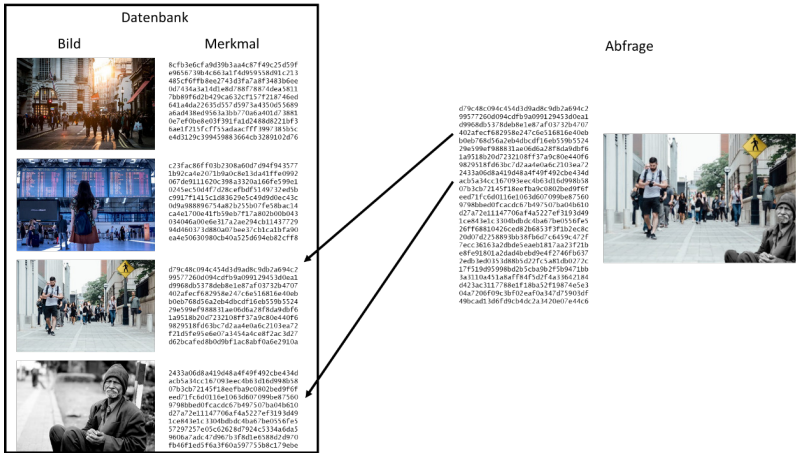
Abbildung 4.3: In der Datenbank werden Bilder und Merkmale gespeichert. Die Abfrage erzeugt aus dem Abfragebild eine Menge von Merkmalen. Diese werden in der Datenbank gesucht. Eine Übereinstimmung zeigt, dass Teile eines Bildes in der Datenbank in dem Bild der Abfrage vorkommen.

In unserer Implementierung stellte sich heraus, dass 500 Merkmale bei der Indexierung und 2000 Merkmale der Suche den besten Kompromiss darstellen. Dies führt immer noch zu einer hohen Erkennungsrate, aber gleichzeitig auch zu einem akzeptableren Speicherverbrauch.