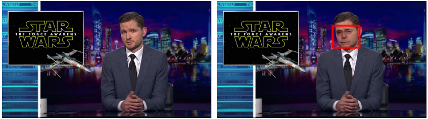
Abbildung 4.4: links: originaler Video-Frame; rechts: Deepfake-Manipulation und Gesichtserkennung (rot)

Im folgenden Bildpaar ist hierfür das Detektionsergebnis zu sehen. Man kann erkennen, dass die als Fälschung signalisierten Pixel im tatsächlich manipulierten Bild (rechts) viel dichter liegen als im unverfälschten Original-Frame (links). Durch geeignete Wahl eines Schwellwerts für diese Dichte wird eine eindeutige Klassifikation möglich.