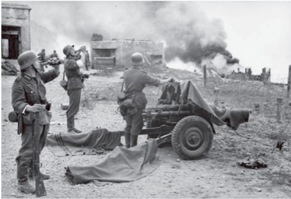
Abb. 23: Dieppe, an der französischen Atlantikküste – Infanteristen und Artilleristen, Sommer 1942