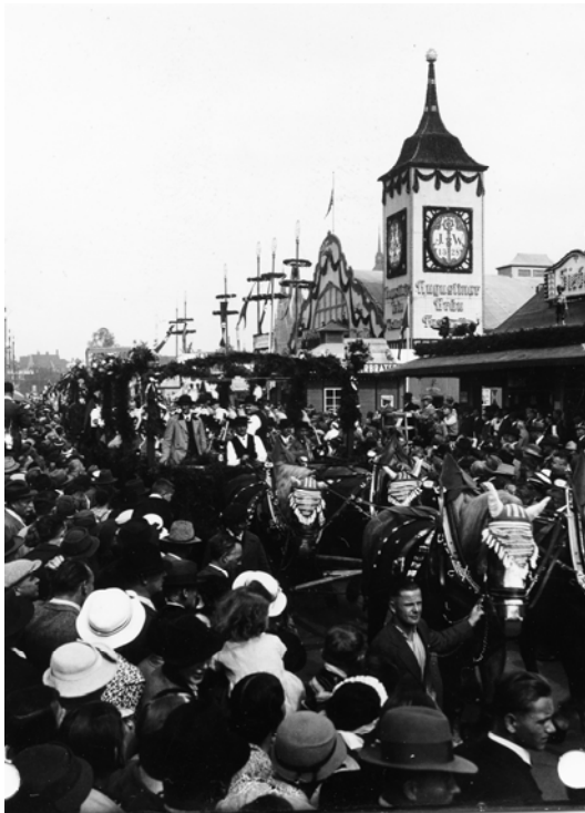
Abb. 12: Theresienwiese, München, Oktober 1935 (1)

Das Oktoberfest 1935 und das Bier in den Vorkriegsjahren