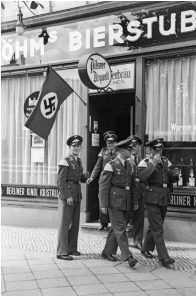
Abb. 20: Angehörige einer Musikkapelle der SA vor einer Bierstube, Berlin, 1937

Quelle: bpk Bildagentur, Nr. 70163173, Fotograf Josef Donderer