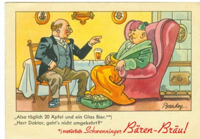
Abb. 25: Werbekarten von Bären-Bräu in Schwenningen – eine Serie, die spätestens seit 1938 Verwendung fand; links eine Karte als Feldpost vom November 1940, rechts privat verschickt im Juli 1944