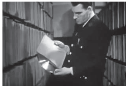
14a-d Von oben nach unten: Impressionen der Aufzeichnung der Musik sowie der industriellen Fertigung und Verpackung von Schellack-Platten und dem Archiv mit Master-Kopien in der RCA Victor Fabrik in Camden in CommandPerformance.