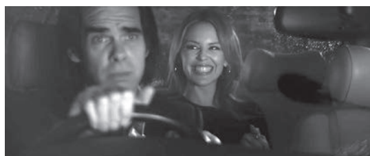
13a-c Nick Cave in stilisierten und teilweise abstrahierten Alltagsszenen – in seinem Schlafzimmer, beim Fernsehabend mit seinen Söhnen und als Chaffeur von Kylie Minoque – in 20.000 Days on Earth.