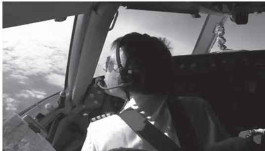
7 Logistik und Touralltag in Impressionen aus dem Tour-/ Festivalfilm IRON MAIDEN – FLIGHT 666 mit Sänger Bruce Dickinson als Pilot (unten) und Sänger im Backstage-Bereich (oben).

beschränkten Zutritts und der After-Show-Partys, bisweilen den Gesichtern des Tour-Alltags und dem Gestus einer rituellen Performance (vgl. Abb. 7a–b). Die in der Regel eher monotonen, repetitiven Aspekte von Musikveranstaltungen blenden die Darstellungen dabei aus. Häufig nähern sie sich auch historisch nicht an den Star an (vgl. für Darstellungsformen aktueller Tour-Rockdocumentaries über weibliche Popstars u. a. Jagl und Knaus 2015: 253).