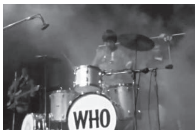
9a-c Blick auf die Bühne aus dem Bühnengraben und dem Publikum auf The Who im Festivalfilm Monterey Pop