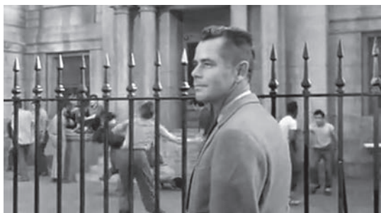
11 Jugendliche tanzen in Blackboard Jungle auf dem Schulhof im Takt von Rock Around The Clock .

kulturellen Landschaft in den 1950er-Jahren in den Vereinigten Staaten wechselten nachhaltiger als zuvor die präferierten Narrationen und Genres in Bezug auf die Filme und wurden mit der parallelen Ausdifferenzierung der Popmusik zunehmend komplexer.