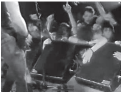
10a–d Die Inszenierung von jugendlichen Thrash-Metal-Fans im Ruhrgebiet der 1980er-Jahre zwischen Rockumentary-Konzertperspektiven und Milieustudie in Thrash, Altenessen .