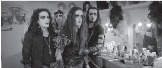
12a-b «Artistic yet accessible to a wide audience»: Der Bruch mit Erwartungsmustern als komödiantische Verharmlosung von Musikkulturen im Trailer von Wayne's World (oben) sowie zum Vergleich im Film Pop Redemption(unten).

Finland – heavy metal-music, beautiful scenery of Lapland and humor» (Nordberg zitiert in Making Movies 2018).