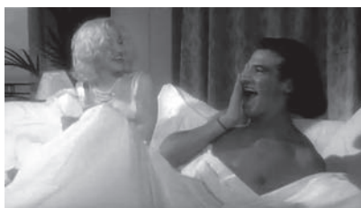
8a–c Spiel mit den Musiker-Personae zwischen Bühne und Bett in Madonna: Truth or Dare .