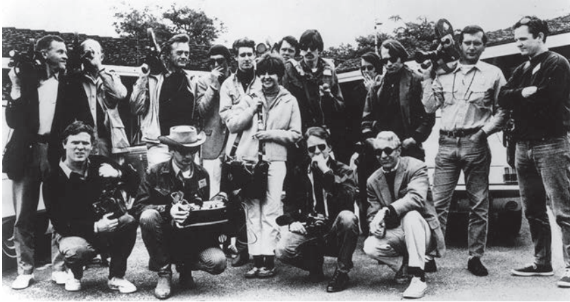
2 Gruppenfoto des Filmteams bei den Dreharbeiten zu Monterey Pop.