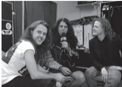
18a–c VJs verschiedener MTV-Formate (von oben nach unten): Martha Quinn und Alan Hunter in den frühen MTV-Tagen, Peter Zarella 1988 in The Cutting Edge Happy Hour (ehemals I.R.S. Records Presents The Cutting Edge (Bild 2) und Rikki Rachtman 1992 in Headbanger's Ball (Bild 3).