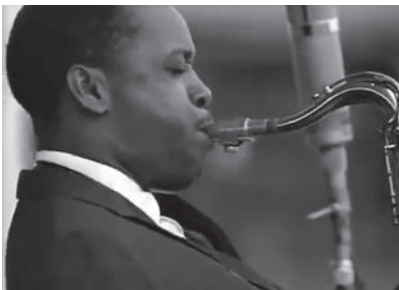
15a–d Yachten, weibliche Zuschauer und Sonny Stitt bei seinem Auftritt in Jazz on a Summer's Day .

an einem speziell für das Event konzipierten Ort 8 veranstaltet wird.