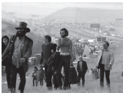
16a-d Impressionen des Endes von Gimme Shelter: Mick Jagger schaut im Schnittraum Aufnahmen des Festivals, steht auf und geht. Im Anschluss laufen Festivalbesucher in den Sonnenaufgang.

Richtungsggebung. Dies sind die Erinnerungen, die sich alle Beteiligten gewünscht hätten und dies sind die friedlichen Erinnerungen, mit denen der Film sein Publikum trotzdem entlässt. Ein neuer Tag beginnt: es geht weiter. Der Erfolg dieser Herangehensweise zeigt sich darin, dass heute viel stärker der <Zeitkapsel>-Wert des Films in Erinnerung bleibt, als die Rolle der Rolling Stones als Initiatoren des Festivals.