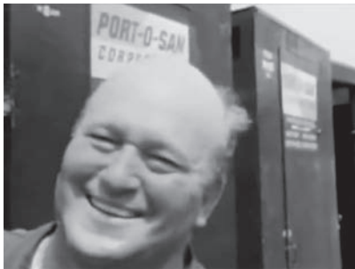
21a–b Interview mit der Reinigungskraft der portablen Toiletten in Woodstock.

Beispielhaft für eine solche technische Umsetzung formelhaft-ästhetischer Aspekte, welche wiederum direkt mit den finanziellen Aspekten der Produktion zusammenhängen, ist das traditionelle dokumentarische Instrument der Talking-Head-Sequenz. Diese Sequenzen nehmen nicht nur eine zentrale Rolle in der Dokumentarfilmgeschichte ein, sondern gehören – von dem Spontaninterview mit der Toiletten-Reinigungskraft in Woodstock (vgl. Abb. 21a–b) bis zu heutigen, vorab geplanten, langen Interviews – zum Standardrepertoire der Rockumentary-Ästhetik. Als Interviewpartner fungieren im Regelfall Bandmitglieder, Industrieakteure und eine häufig angefragte Auswahl etablierter Kernprotagonisten einzelner Genres. Sie werden in der Modernen Rockumentary meist in einem stark verengten Bildkader in einem Hotel oder Backstage-Bereich, bisweilen auch in einem Studio-