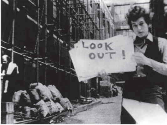
20 Dylan hält in Dont Look Back die Textzeilen des Songs Subterranean Homesick Blues auf Papierschildern in die Kamera, während der Dichter Alan Ginsberg mit einer nicht sichtbaren dritten Person spricht.

ist deshalb die Frage nach seiner ästhetischen Relevanz. Musikvideos zeichnen sich durch einen «specific look, a constructed, organized, and stylized manner of visualizing music» (Williams 2003: 20) aus. Wie die auf Performance basierende Rockumentary, also im Besonderen wie der Konzertfilm, lenkt das Musikvideo dabei das Auge mit «striking, off-ilter shots, objects and figures torqued at odd angles within the frame, and rapid editing» (Vernallis 2004: 111).