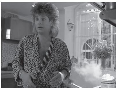
19a–b Darby Crash von den Germs verliest den Mitschnitt-Disclaimer in The Decline of Western Civilization Part I (oben) und Ozzy Osbourne brät im Morgenmantel Speck und Eier in The Decline of Western Civilization Part II (unten).

In beiden Filmen gelang es Spheeris, für die Szenen Trends vorauszusehen. Zudem schuf sie in einer Zeit ohne dauerhafte mediale Archivierung Aufnahmen, die bis heute aufgrund ihrer Seltenheit und eines subtilen Humors – in Form von Punkmusikern, die fluchend den Mitschnitt-Disclaimer vor ihren Konzerten verlesen oder Black-Sabbath-Sänger Ozzy Osbourne, der im Morgenmantel Eierbriet – Kultstatus besitzen (Abb. 19a–b). Die Bedeutung von The Decline of Western Civilization Part II – The Metal Years (USA