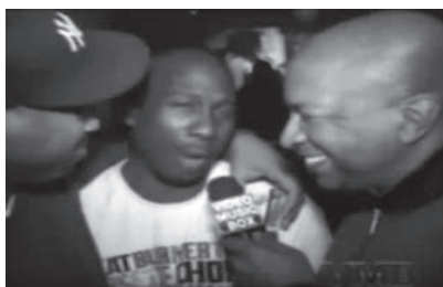
17a- Die urbane Stadt als Kulisse reicht vom Intro der Sendung Video Music Box bis zu den Interviews: beim Halloween Jam (rechts oben), auf der Straße (links unten) und in Clubs (rechts unten).